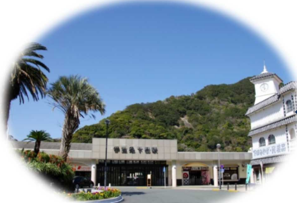
下田駅ロータリー